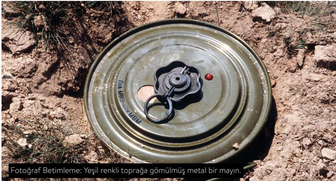
Fotoğraf Betimleme: Yeşil renkli toprağa gömülmüş metal bir mayın.

Anti-personel kara mayınları, bir kişinin mevcudiyeti, yaklaşması veya teması ile infilak edecek biçimde tasarlanmıştır. Onu harekete geçiren kurbanın bizzat kendisidir. 75 yıl aktif olarak kalan ve kurbanını bekleyen anti-personel kara mayınları, yerleştirildikleri yerden çıkarılmadıkları ve imha edilmedikleri sürece de öldürmeye, yaralamaya devam ederler. Kara mayınları İzleme Örgütü (MONITOR) 2018 Raporu'na göre, savaş ve çatışmaların yaşandığı ülkeler başta olmak üzere, geçtiğimiz yıl, anti-personel kara mayınları ve savaş artığı patlayıcılar nedeniyle 2 bin 793 kişi ölmüş, 4 bin 431 kişi de yaralanmıştır. Kayıpların yüzde 76'sını siviller oluşturmaktadır.