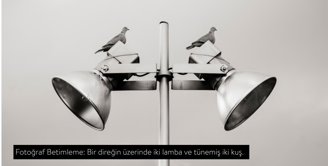
Fotoğraf Betimleme: Bir direğin üzerinde iki lamba ve tünemiş iki kuş.

Bunun en güçlü yasal altyapısı olarak kabul edilmesi gereken Birleşmiş Milletler Engellilerin Haklarına İlişkin Sözleşme'nin ilgili maddesi der ki: