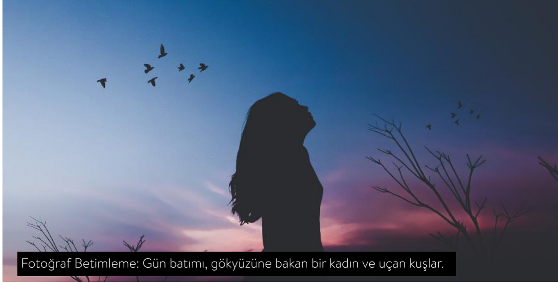
Fotoğraf Betimleme: Gün batımı, gökyüzüne bakan bir kadın ve uçan kuşlar.