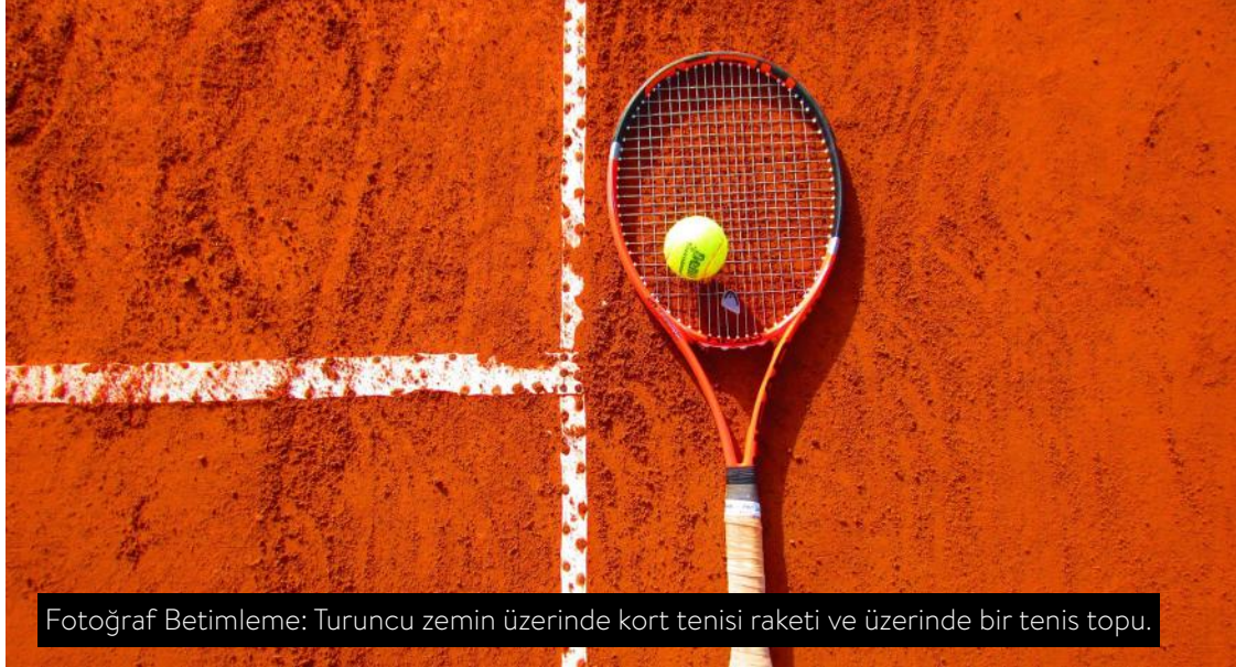
Fotoğraf Betimleme: Turuncu zemin üzerinde kort tenisi raketi ve üzerinde bir tenis topu.

Keza paralimpik oyunlar, işitme engelliler olimpiyatları, vb. uluslararası spor organizasyonlarının sayısı, kapsamı ve görünürlüğü her geçen gün artmakta ve hemen hemen her ülkede engelli spor federasyonlarıyla lisanslı sporcu sayısı da katlanarak artmaktadır.