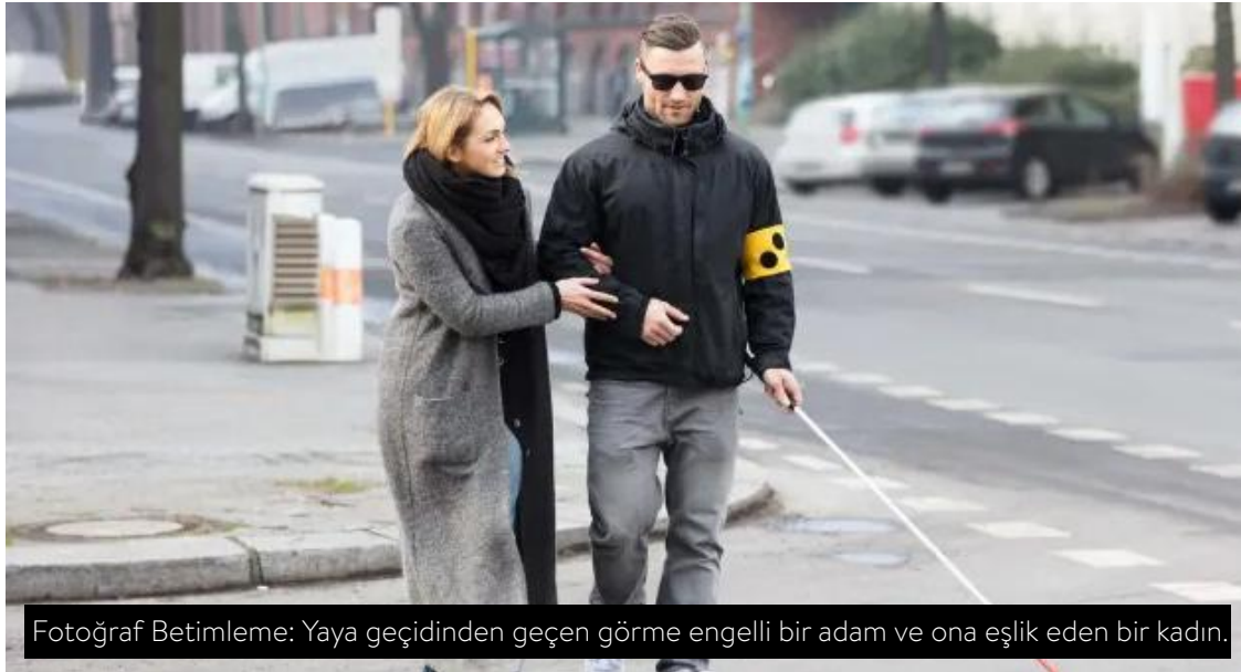
Fotoğraf Betimleme: Yaya geçidinden geçen görme engelli bir adam ve ona eşlik eden bir kadın.

Size göre özgürlük nedir? İstediğin şeyi yapmak, öyle değil mi? Peki ya bağımsızlık? İstediğin şeyi kendi gücünle, kendi yetenek ve olanaklarıyla yapmak. İstediğin kadar, istediğin yere uçmak; ama kendi kanatlarınla.