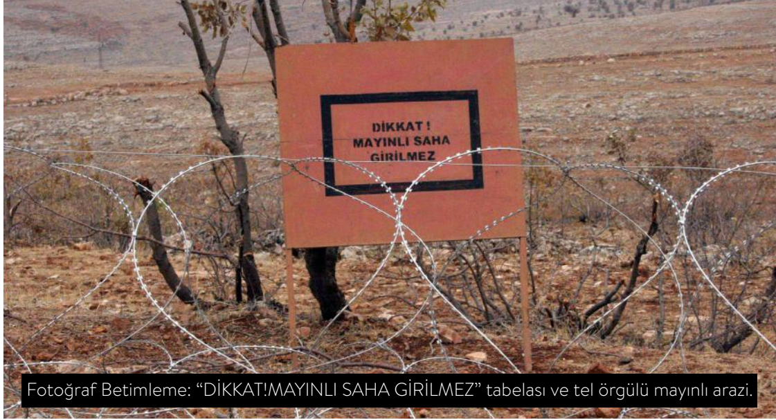
Fotoğraf Betimleme: "DİKKAT!MAYINLI SAHA GİRİLMEZ" tabelası ve tel örgülü mayınlı arazi.

Taahhüdünü de 2014 yılına kadar yerine getireceğini bildirdi. Bu süre içerisinde de yeni mağduriyetlerin yaşanmaması için önlemler alınacak; mayınlı alanlarda yaşayanlara yönelik mayın/patlayıcı risk eğitimi verilecek; var olan mağduriyetlerin giderilmesi için programlar hazırlanacak ve uygulamaya konulacaktı.