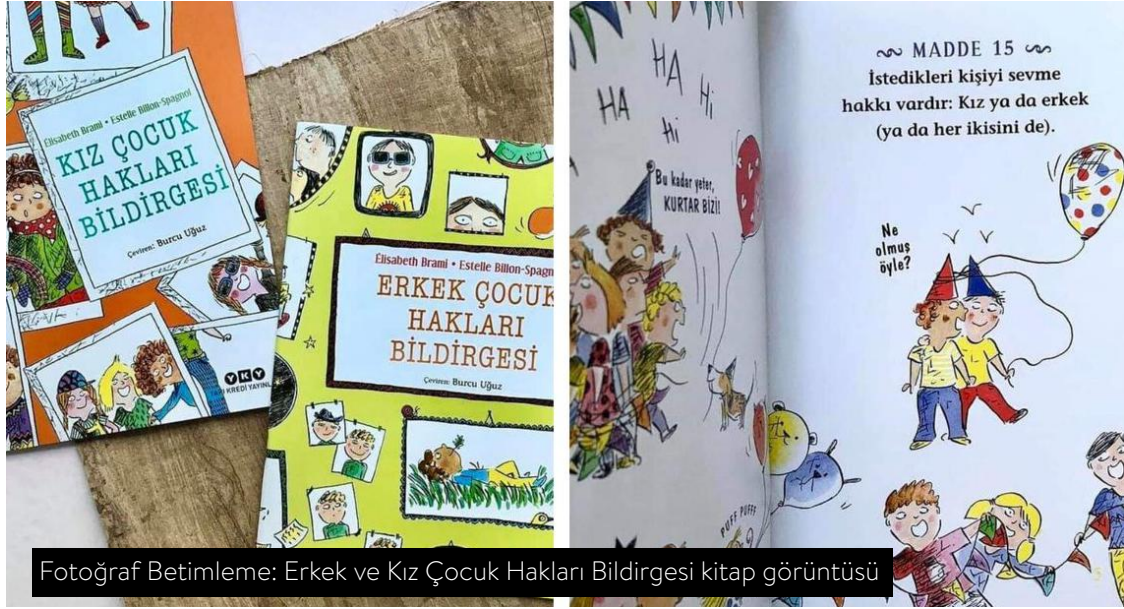
Fotoğraf Betimleme: Erkek ve Kız Çocuk Hakları Bildirgesi kitap görüntüsü