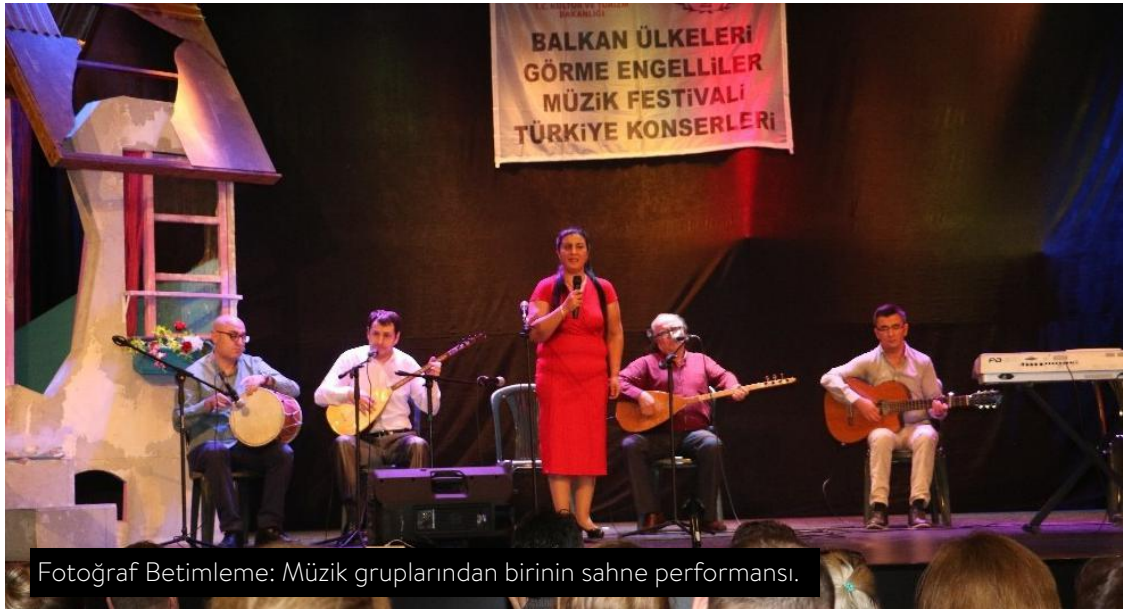
Fotoğraf Betimleme: Müzik gruplarından birinin sahne performansı.

Biz bu işleri Ankara'dan yürütüyoruz, telefon trafiğimizin nasıl yoğun olduğunu söylemeye gerek yok. İzmir, Aydın Manisa ve Tire'deki yerel yönetimleri, federasyonumuza bağlı olan dernekleri, nazımızın geçtiği arkadaşlarımızı seferber ediyoruz.