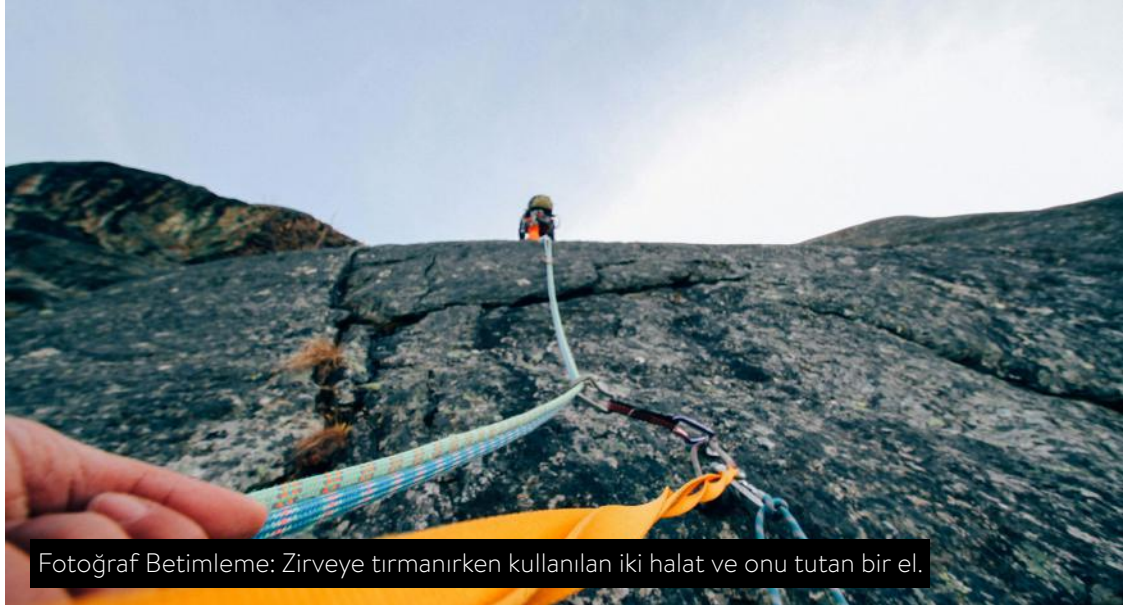
Fotoğraf Betimleme: Zirveye tırmanırken kullanılan iki halat ve onu tutan bir el.