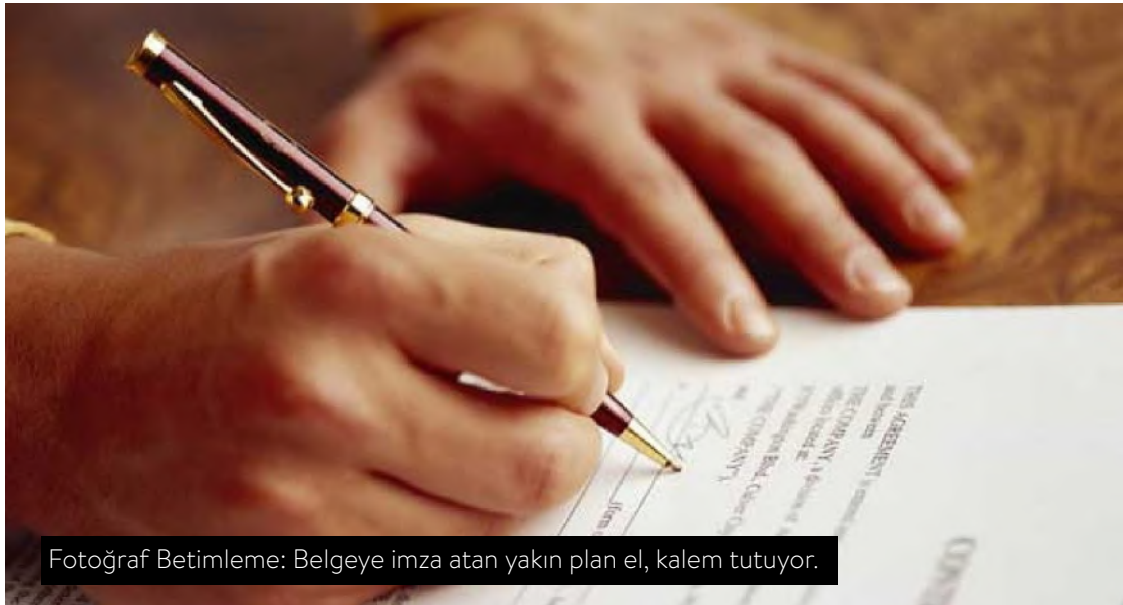
Fotoğraf Betimleme: Belgeye imza atan yakın plan el, kalem tutuyor.

c) Yaş ya da engele bakılmaksızın engelli bireylere bireyselleşmiş destek sağlanması için daha çok kaynak tahsis edilmesi ve tüm illerde engelli tüm bireyler için insan hakları temelli akıl sağlığı hizmetlerinin sunulması;