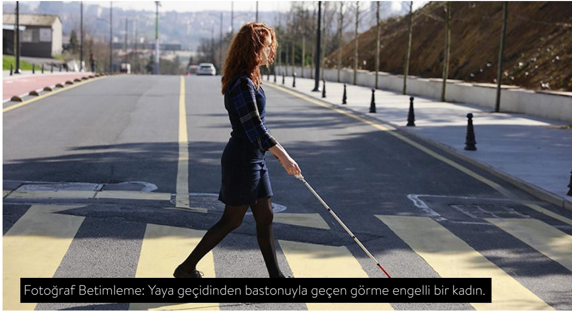
Fotoğraf Betimleme: Yaya geçidinden bastonuyla geçen görme engelli bir kadın.