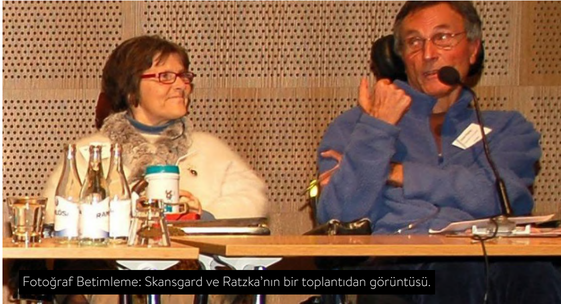
Fotoğraf Betimleme: Skansgard ve Ratzka'nın bir toplantıdan görüntüsü.

Adolf Ratzka ve Bente Skansgård, Bağımsız Yaşam Hareketi'nin iki öncüsü. Biri İsveçli, diğeri Norveçli. Avrupa'da hem ülke içinde hem de sınır ötesine seyahat etmenin pek çok engelli için erişilebilir olmadığı zamanlarda yolculuklar yaparak engelleri aşmaya niyetlendiler. Atlantik'in ötesine geçtiklerinde tanıştılar sivil haklarla ve bağımsız yaşam ruhuyla. Bugün adları bağımsız yaşam hareketinin simgesi olarak tüm dünyada yankılanıyor.