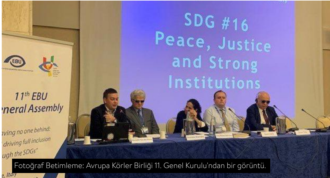
Fotoğraf Betimleme: Avrupa Körler Birliği 11. Genel Kurulu'ndan bir görüntü.

Türkiye, EBU Genel Kurulunda Türkiye Körler Federasyonu üyesi 6 görme engelli delege ile temsil edildi. Kurulda Avrupa Körler Birliğine üye görme engellilerin sorunlarının çözümüne ilişkin genel tartışmalarla birlikte çoğu kez görme engelliler için önemli olan fiziksel çevreye ve bilgiye erişim gibi özel konular da ele alındı.